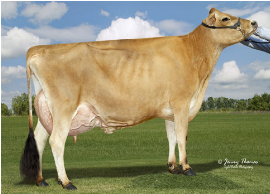
JX OAK LANE EUSEBIO ERICA {5} GRANDDAM